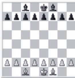
Partie de pions, Fous et Rois