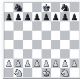
Partie de pions, Cavaliers et Rois