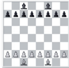
Partie de pions et Fous