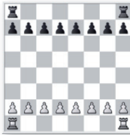
Partie de pions et Tours